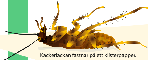
Kackerlackan fastnar på ett klisterpapper.

För att förstå ohyrans omfattning utplaceras feromonfällor. När inga kackerlackor längre fastnar bedöms problemet vara avhjälpt.